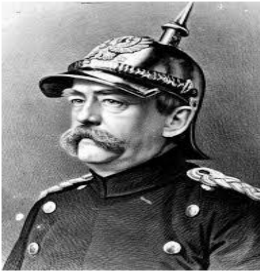
Рис. 1. Отто фон Бісмарк.

політичну інтеграцію регіонів і заспокоїти суспільство сформулював завдання з побудови системи соціального страхування. Певною мірою ця система була покликана стати альтернативою профспілковим страховими програмами, тим самим ускладнюючи фінансове становище профспілкових організацій і привчаючи робітників у життєвих колотнеч покладатися не так на них, а на державу. Це було досить вдале стратегічне рішення, що забезпечує лояльність робітничого класу по відношенню до держави і зниження революційних настроїв в суспільстві.