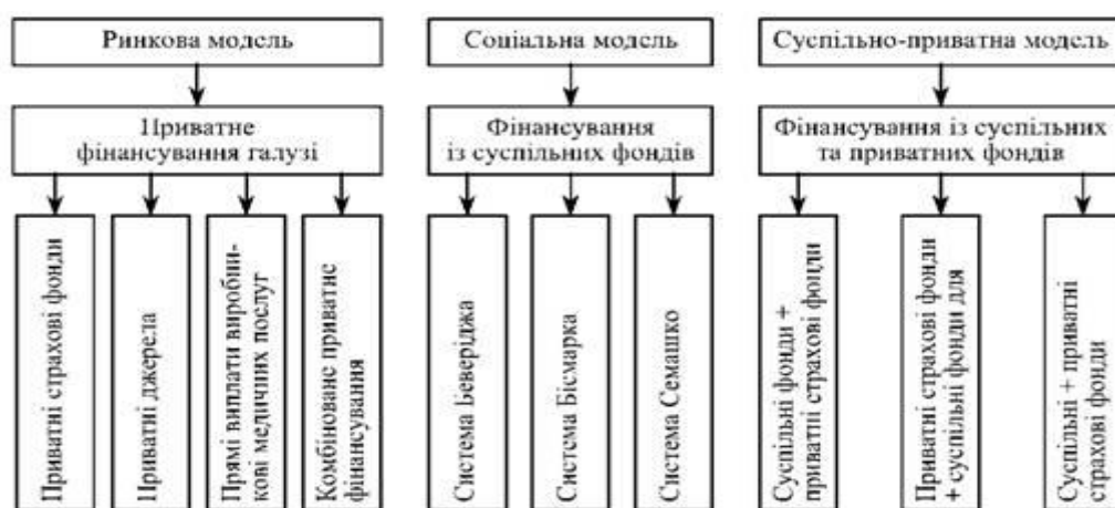
Рис. 1. Моделі організації та фінансування галузі охорони здоров'я

Принципи регулювання видатків на охорону здоров'я постійно модифікуються та удосконалюються в усіх країнах. Основні існуючі моделі організації охорони здоров'я представлені на рис. 1.