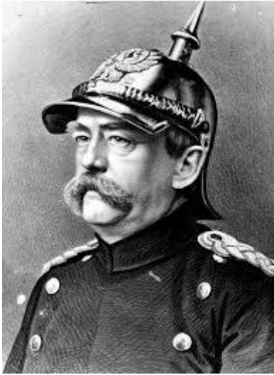
Рис. 3. Канцлер Німеччини Отто фон Бісмарк.

Крім страхування ризику втрати здоров'я як такого, система державного медичного страхування забезпечувала перерозподіл доходів, шляхом оплати медичних послуг через страхові фонди. Це дозволило добитися пом'якшення гостроти соціальних проблем, пов'язаних з ризиком втрати працездатності малозабезпечених верств населення.