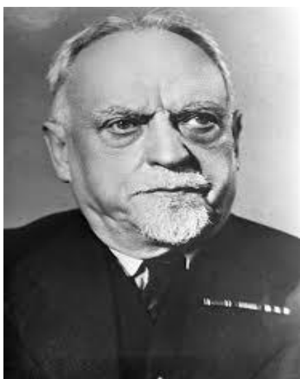
Рис. 1. Микола Семашко, перший нарком охорони здоров'я колишнього Радянського Союзу.

Державну систему охорони здоров'я колишнього СРСР називають системою Семашка на прізвище першого народного комісара охорони здоров'я СРСР, який створив зразкову систему охорони здоров'я на території колишнього Радянського Союзу, яку в подальшому запозичили багато країн світу.