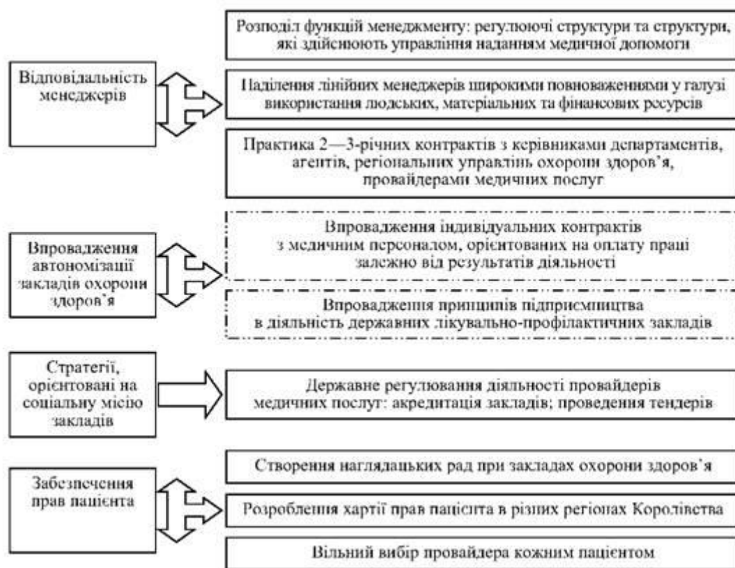
Рис. 1. Складові системи КРБМ

Концептуальною засадою стала зміна організаційної структури та фінансових потоків: максимально використані переваги існування в країні ринку медичних послуг із збереженням контролю держави за якістю надання медичної допомоги. Основним механізмом було вибрано розподіл функцій фінансування медичних закладів та безпосереднього надання медичної допомоги. Такий підхід привів до виникнення внутрішніх "квazіринків", що привнесло в систему державно організованої системи охорони здоров'я стимули, які забезпечують конкуренцію з приватним сектором. Державні та приватні медичні заклади конкурують між собою за одержання державних фінансових ресурсів.