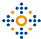
Схема фінансування громадського здоров'я

Бюджетний кодекс України: Стаття 87 “е) державні програми громадського здоров'я та заходи боротьби з епідеміями” з 01.01.2020